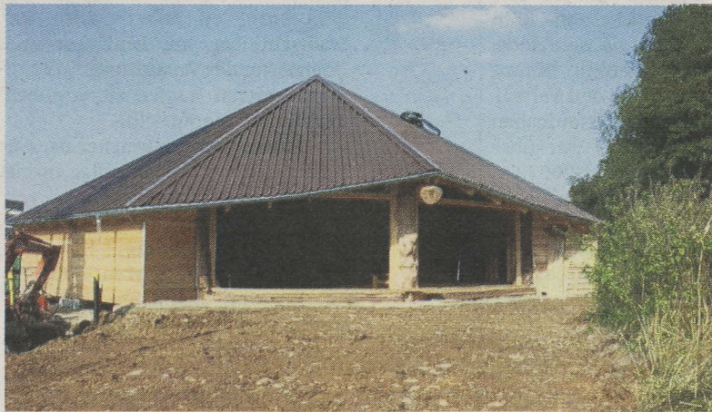
Die Biberburg ist schon fast fertig. Noch fehlt aber die Aussengestaltung.

Die Biberburg wird den Betrieb im Frühling 2009 aufnehmen. Je-